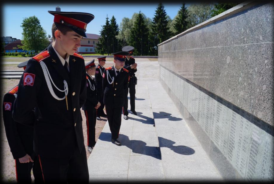
На мемориале «Гостилицкий»