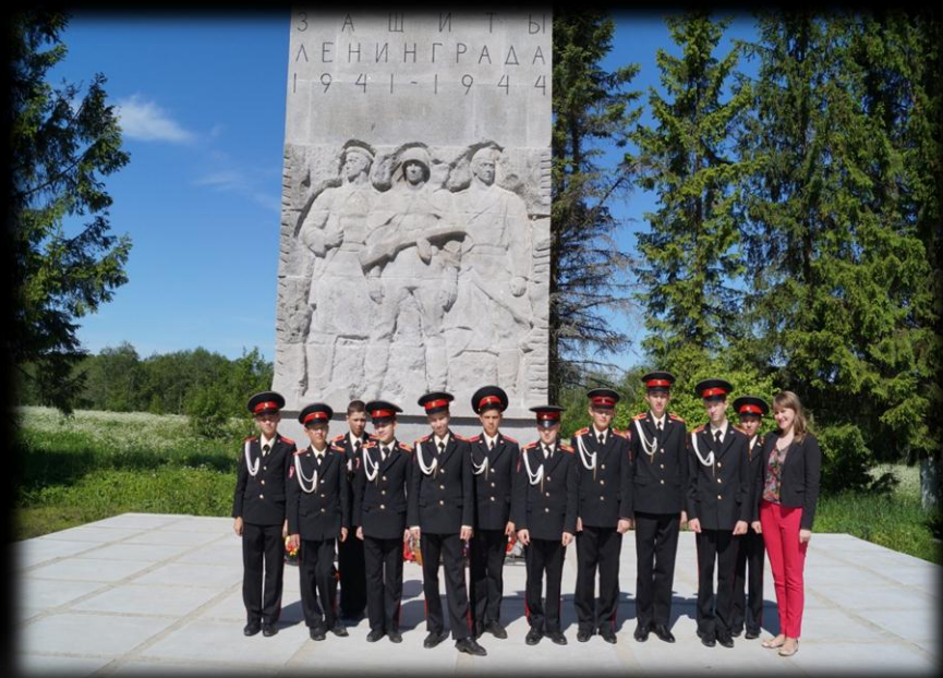
У памятника «Январский гром»