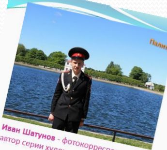
Иван Шатунов - фотокорреспондент проекта и автор серии художественных фотографий проекта